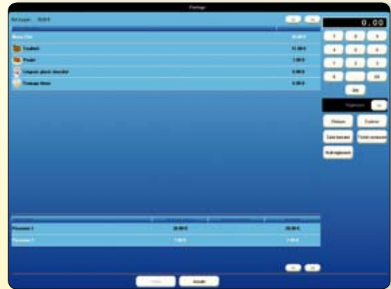
Effectuez le partage de notes en toute simplicité